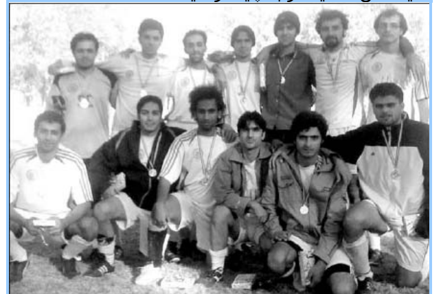
تیم دانشکده مهندسی مکانیک به مقام قهرمانی مسابقات فوتبال دانشکده های دانشگاه دست یافت.