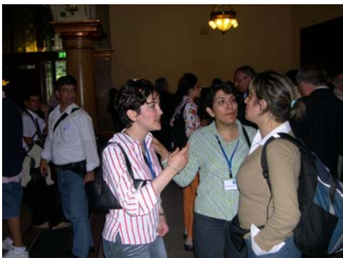
گروهی از دانش‌آموختگان اخیر در حال گفتگو در هنگام تنفس