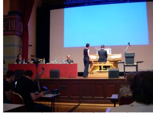
آغاز گردهمایی با آهنگ ارگ تاریخی توسط پرفسور ژاندر