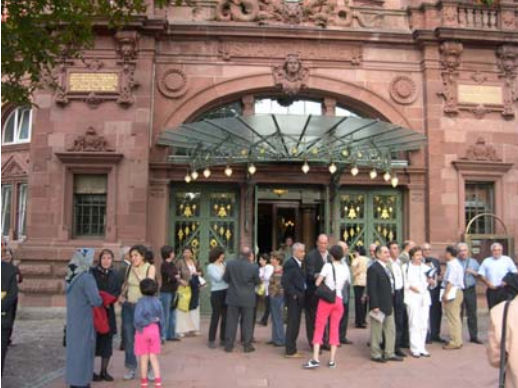
تجمع در مقابل درب اصلی ساختمان کنگره هایدلبرگ