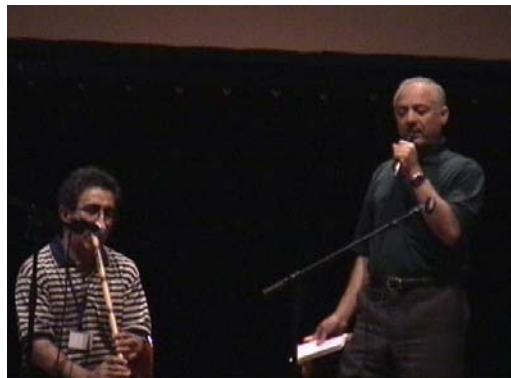
هنرنمایی او از توسط محمد رضا غفاری بهمراهی نی زاهد