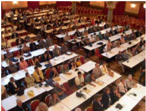
شرکت‌کنندگان در سالن اصلی کنگره هایدلبرگ