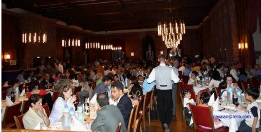
مراسم شام در کاخ تاریخی هایدلبرگ