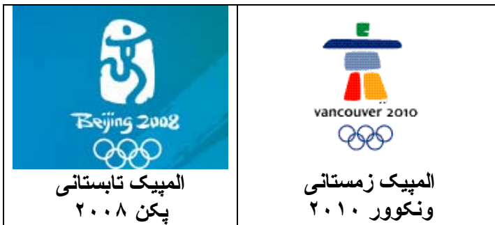
المپیک تابستانی پکن ۲۰۰۸