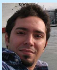
عماد عاقل ملکی و. ۱۳۷۹ کامپیوتر د. آزاد